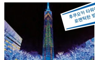
후쿠오카 타워에서 로맨틱한 밤을

후쿠오카 타워의 거대 트리 일루미네이션을 중심으로, 주위의 나무도 바다와 하늘을 이미지화한 블루 일루미네이션으로 환상적인 세계를 연출.