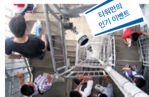
타워만의 인기 이벤트!

577개의 계단을 올라 전망실까지 GO! 후쿠오카 타워의 비상계단이 특별히 개방됩니다. 이 이벤트에서만 받을 수 있는 참가상도 기대하세요!