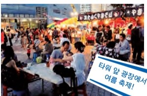
타워 앞 광장에서 여름 축제!

타워 앞 광장에서 노상 점포와 금붕어 건지기를 즐길 수 있는 축제 광장과 철석 라이브를 개최! 전망실에는 종이에 소원을 적어 매다는 단자쿠를 체험할 수 있는 '소원 코너'가 등장.