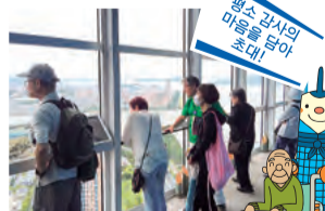
팬스 김사의 마음을 담아 초대!

65세 이상 분들을 후쿠오카 타워에 무료로 초대. 기념 사진 특별 할인과 같은 서비스, 손자 손녀와 함께 즐길 수 있는 행사도 가득!