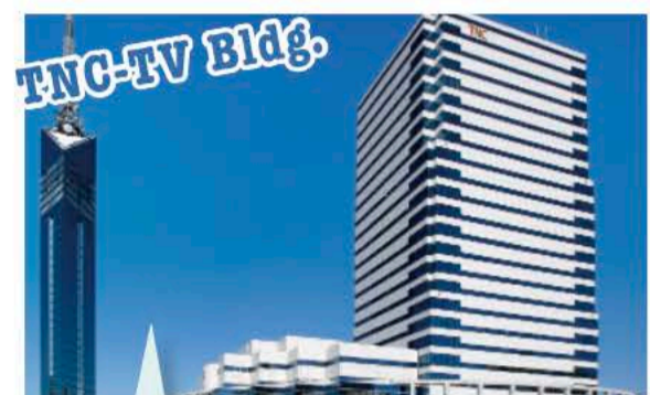
TNC放送会館・Paveria MAP 12

東西1.4kmに広がる白い海浜と、穏やかな博多湾を一望できる都心に近い海辺のリゾートです。シャワー・更衣室も完備。また、ビーチスポーツ・音楽イベント等にも良く利用されています。