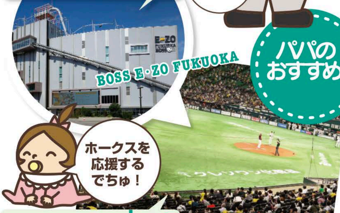
福岡PayPayドーム MAP 26

2020年7月に福岡PayPayドーム横にオープンした7階建てのエンタメビル。日本初のビル屋上からスタートするレールコースター「つりZO」を始めとした最新アトラクションの他、チームラボのミュージアム、日本・九州初上陸の店舗が揃うフードホールなど、ここでしか味わえない様々なジャンルの最新エンタメが堪能できる。