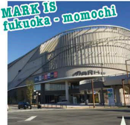
MARK IS 福岡ももち MAP 24

福岡ソフトバンクホークスの本拠地で、日本初の開閉式屋根を備える全天候型スタジアムです。野球をはじめ、各種スポーツ、コンサートなど年間を通じて多彩なイベントを開催しています。