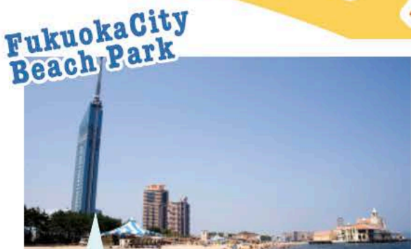
シーサイドももち海浜公園 MAP 4

東西1.4kmに広がる白い海浜と、穏やかな博多湾を一望できる都心に近い海辺のリゾートです。シャワー・更衣室も完備。また、ビーチスポーツ・音楽イベント等にも良く利用されています。